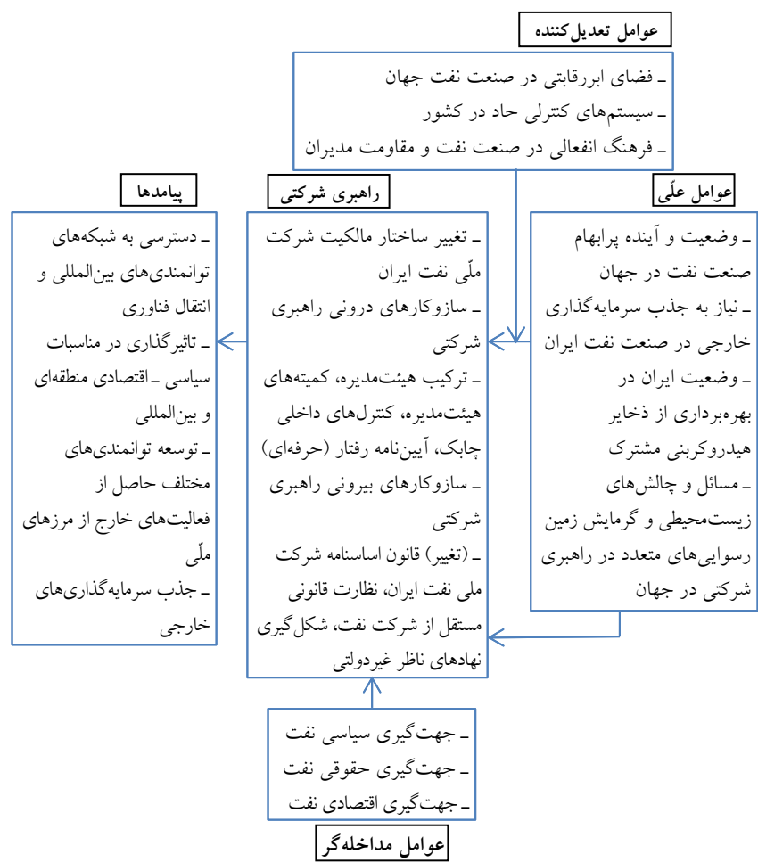
شکل ۲: چارچوب مطلوب راهبری شرکتی برای شرکت ملی نفت ایران در راستای بین‌المللی شدن

شکل (۲)، چارچوب مطلوب راهبری شرکتی را برای شرکت ملی نفت ایران در راستای بین‌المللی شدن نشان می‌دهد. باید در نظر داشت که واحد تحلیل در این پژوهش، سازمان است. بنابراین، چارچوب پیشنهادی ناظر بر متغیرهای سطح سازمانی است و متغیرهای فراسازمانی در این چارچوب لحاظ نشده است.