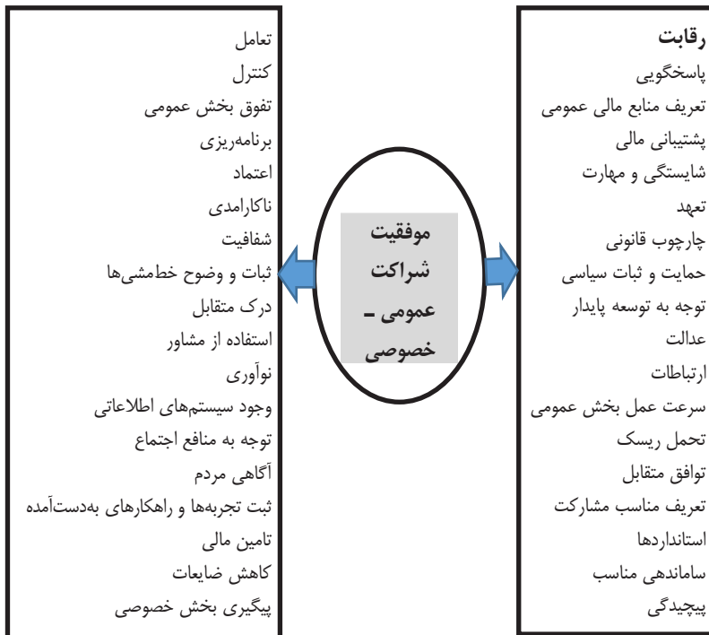
شکل ۱: مدل مفهومی پژوهش