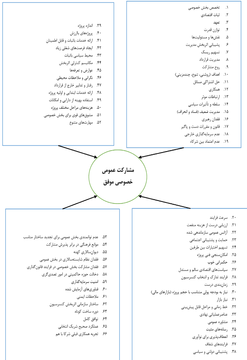
شکل ۳: مدل مفهومی پژوهش