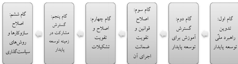
شکل ۲: گام‌های اجرای مدل نهاده‌سازی سیاست‌گذاری توسعه‌پایدار در ایران

در مجموع مدل چهار بعدی (شناختی، نهادی- قانونی، سیاسی و اجتماعی) نهاده‌سازی سیاست‌گذاری توسعه‌پایدار در ایران بر مبنای نظرهای متخصصان داخلی، اسناد بین‌المللی و تجربه سایر کشورها در زمینه توسعه‌پایدار و متناسب با موانع چهارگانه طراحی شد و مؤلفه‌های مختلفی مانند آموزش عمومی و تخصصی، آموزش سیاست‌گذاران، تقویت قوانین، اصلاح تشکیلات (تشکیل کمیسیون و سازمان فرا وزارتی)، ترسیم فرآیند سیاست‌گذاری، افزایش ضمانت اجرای قوانین، معرفی روش‌های نوین سیاست‌گذاری، گسترش تعامل بین بخشی و بین سطحی، تدوین راهبرد ملی توسعه‌پایدار، تشکیل شورای ملی توسعه‌پایدار، گسترش مشارکت و اعتمادسازی را دربر گرفت. نهاده‌سازی سیاست‌گذاری توسعه‌پایدار مستلزم اجرای همه پیشنهادها مطرح شده در این مدل به صورت گام‌به‌گام و در یک فرآیند زمانی مناسب است. شکل زیر گام‌های اجرای مدل پیشنهادی را نشان می‌دهد.