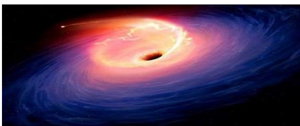
شکل ۱: سیاه‌چاله کیهانی

سیاه‌چاله مکانی در فضا است که دارای میدان گرانشی فوق‌العاده بالایی است، به صورتی که هیچ شیئی، حتی نور، قادر به گریز از میدان گرانشی آن نیست. در سیاه‌چاله‌ها مکانی به اسم افق رویداد وجود دارد که هیچ شیئی بعد از ورود به آن توانایی بازگشت ندارد. در حقیقت، سیاه‌چاله آن شیء را می‌بلعد و این یکی از اسرار سیاه‌چاله‌هاست که دانشمندان در مورد چگونگی آن پژوهش می‌کنند (شهبازی و همکاران، ۱۳۹۳). از آنجایی که نوری از سیاه‌چاله‌ها بیرون نمی‌آید، آن‌ها نامرئی هستند، ولی می‌توانند بودن خود را از راه کنش و واکنش با ماده اطراف خودشان نشان دهند (Tull et al., 2016). شکل (۱)، یک سیاه‌چاله کیهانی را نشان می‌دهد.